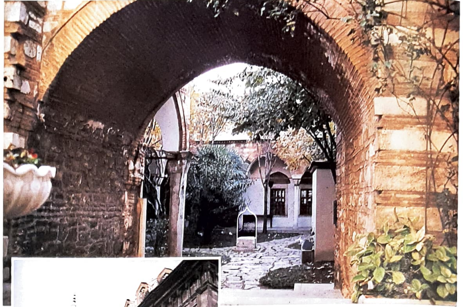
Sultanahmet ile Ayasofya Camileri arasında yer alan Cedid Mehmed Efendi Medresesi girişindeki kuyu bileziği. (Üste)

Yine Alay Kökü Caddesi'nde Sultan III. Ahmed 'e onüç yıl hizmet etmiş Hacı Beşir Ağa 'nın camii ve külliyesini görürsünüz. Giriş kapısının üzerinde Yesarizade Mustafa İzzet Efendi 'nin hatıyla yazılmış bir kitabe bulunmaktadır. Tek kubbeli olan caminin tek şerefeli olan bir mimaresi vardır. Camiin, semahane, çilehane, mutfak ve şeyhlerin kaldığı üç katlı ahşap binası bugün Batı Trakya Türkleri Derneği'nce kullanılmaktadır. Alemdar Caddesi tarafından İstanbul sebilleri arasında barok üslubunun ilk uygulandığı ve değişik bir örnek olarak özel bir konuma sahip olan Hacı